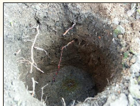
秋田商会屋上庭園植栽基盤(大正5年竣工)