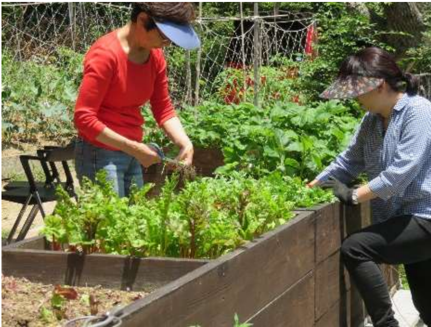
コミュニティガーデンとしての予防園芸療法

浅野 ：私もそう思います。白波瀬先生がおっしゃったように、自然発生を待つのではなく、思わず関わりたくなるような巧みな仕掛けをもつハードを戦略的に作り、参画を誘発することによって、色々な意見が集まり、文化が生まれて、それがスパイラルになって、躍動する都市ができていく、第3のコミュニティが生まれていくという感じになればとても素敵だろうなと思います。