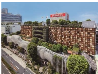
玉川高島屋ショッピングセンター