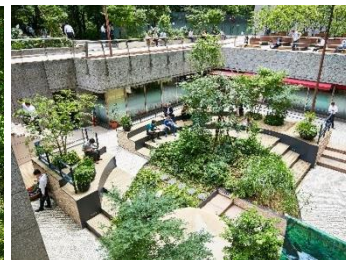
大手町ファーストスクエア