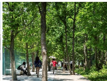
大手町タワー-大手町の森