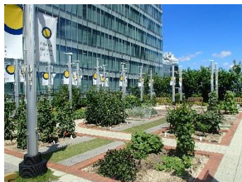
大阪ステーションシティ