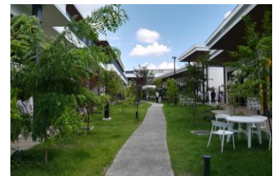
大和リース(株) ブランチ松井山手