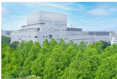
ローム(株) 「森の中の本社工場」

前回の「SEGES大阪ALL都市のオアシス見学会」を開催して以降、新たにSEGES認定緑地となった「ローム(株)本社」「IDEC(株)いずみの森」「ブランチ松井山手」について、緑地の概要、その魅力と価値づくりの取り組みをお話しいたします。