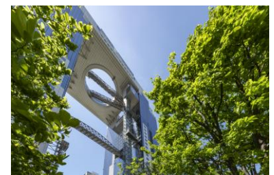
積水ハウス(株) 新・里山 希望の壁