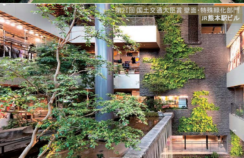
第21回 国土交通大臣賞 壁面・特殊緑化部門 JR熊本駅ビル