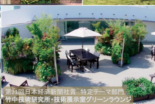
第21回 日本経済新聞社賞 特定テーマ部門 竹中技術研究所・技術展示室グリーンラウンジ