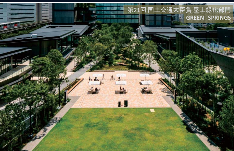
第21回 国土交通大臣賞 屋上緑化部門 GREEN SPRINGS