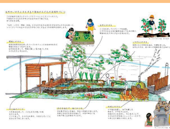
第33回 第一生命財団賞 一般社団法人異才ネットワークの完成イメージ