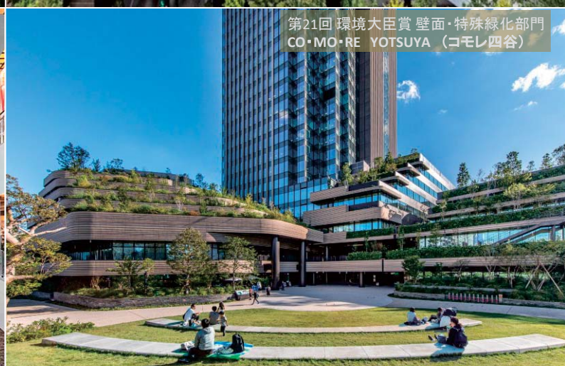
第21回 環境大臣賞 壁面・特殊緑化部門 CO・MO・RE YOTSUYA (コモレ四谷)