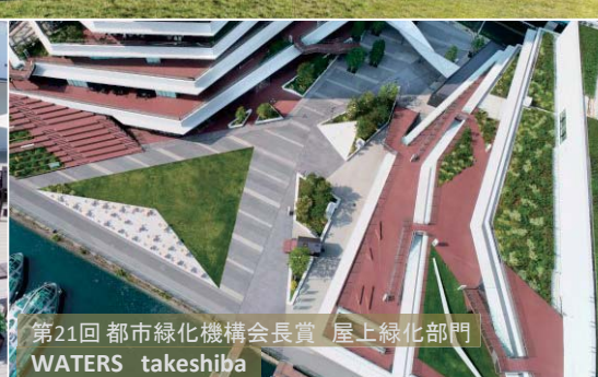
第21回 都市緑化機構会長賞 屋上緑化部門 WATERS takeshiba