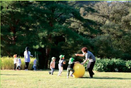
第42回国土交通大臣賞

※ 活動助成金は、「緑の市民協働部門」の受賞団体のみを対象とさせていただきます。