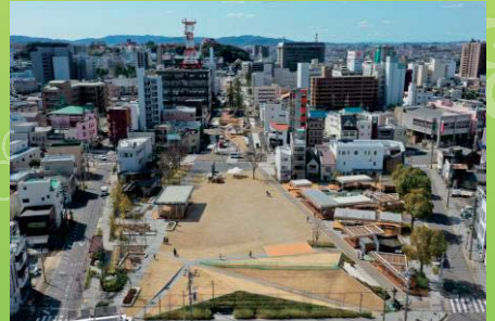
第42回 国土交通大臣賞