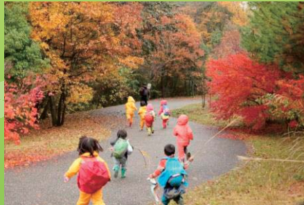
第42回国土交通大臣賞