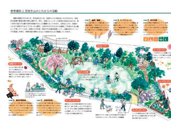
第33回 国土交通大臣賞 花咲き山のポケット・ガーデン

日常的な花や緑の活動を通して、地域の活性化や子どもたちへの情操教育、身近な環境の改善に寄与するプランを募集します。