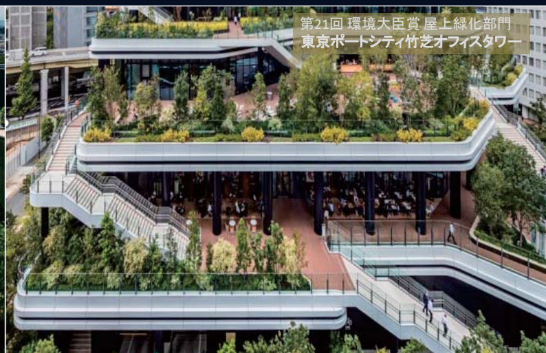
第21回 環境大臣賞 屋上緑化部門 東京ポードシティ竹芝オフィスタワー