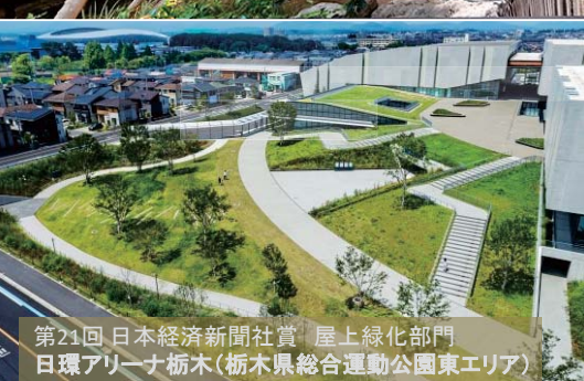
第21回 日本経済新聞社賞 屋上緑化部門 日環アリーナ栃木(栃木県総合運動公園東エリア)