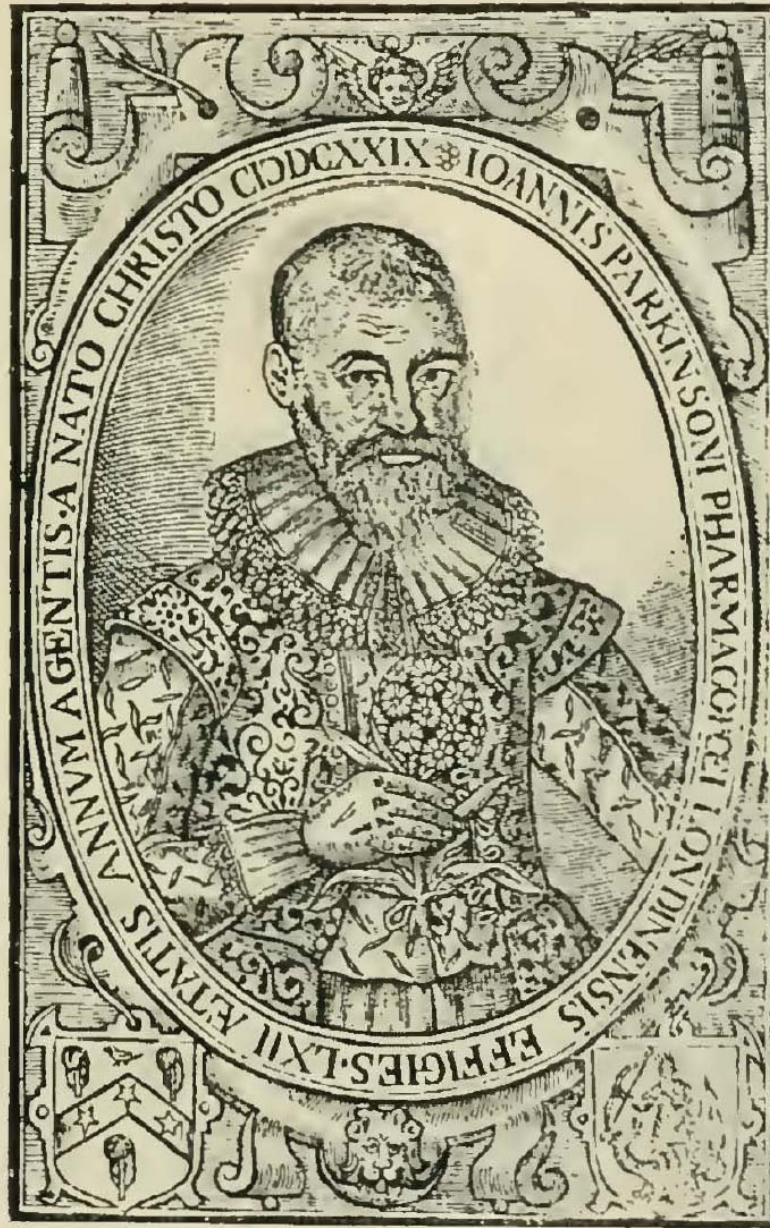
PARKINSON. FROM THE TITLE-PAGE FOR HIS "PARADISUS."