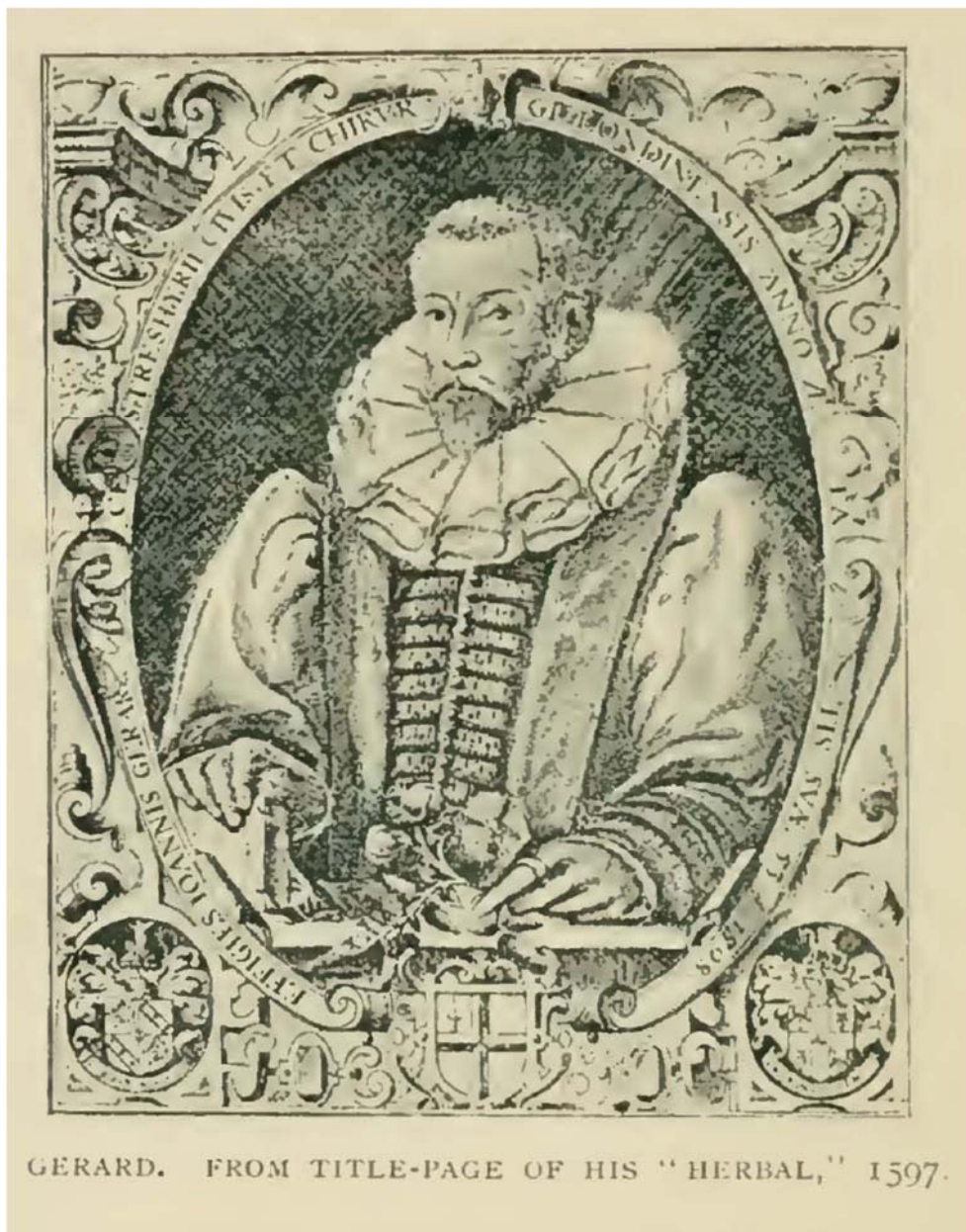
[ 図 8-2 ] ジェラード 著書『植物誌』扉のページより 1597年

「コタニワタリ的一种 finger Hart's tongue・・・私はこれをエセックスのマッチダンモウ Much-dunmow にある Cranwick 氏の庭園で見つけ、彼は私の庭園用に植物を一つくれた」。このようなジェラードを援助した友人の数は膨大であったが、彼らのうちほとんどの人物については、たとえば「ロンドンの学識深い商人であるジェームズ・コール氏、植物の愛好家で植物の知識に関して極めて熟練している」とジェラードが紹介している数少ない言葉以外にはまったく知られていない。「ガス氏は尊敬すべき紳士で、かつ珍しい植物をとて喜んで人だが、彼はとても気持ちよく私に」クルシウスから受け取ったナルコユリの一種 Solomon's seal を「分けてくれた」。しかしながら、何人かの人々の名前はし