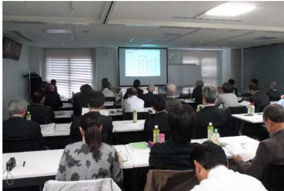
・令和元年度 研究者発表会の様子

新型コロナウイルスにより、研修機会や講演会などが少なくなっている中、多くの方々に有用な技術情報を提供することを目的として、広く一般の方々にも参加を募らせていただくことにしました。