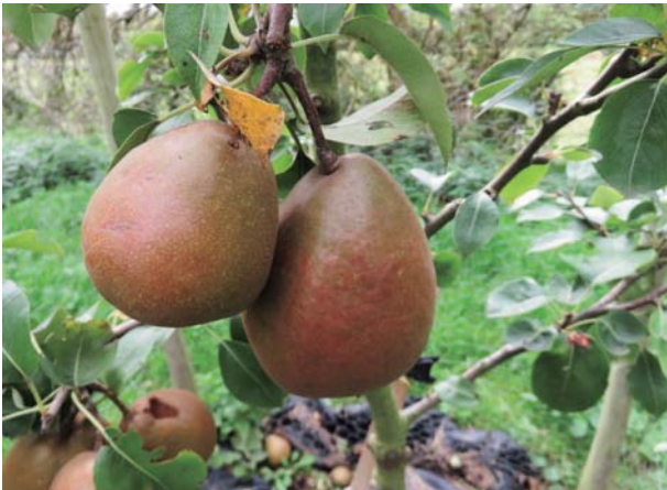
図3 ウォーデン梨 (Black Worcester pears) ウォーデン大修道院ブドウ園 (2020年9月)

範囲に栽培されていた。その収穫の季節はラングランドにより「サクランボの季節」と語られた。サクランボの収穫は夏の盛りにあたり、お祭り騒ぎの時であった。サクランボとイチゴはロンドンの街角で売り歩かれ、「熟れたイチゴはいかが」の呼び声は身近なものだった。桃、セイヨウカリン、プラムも栽培された。