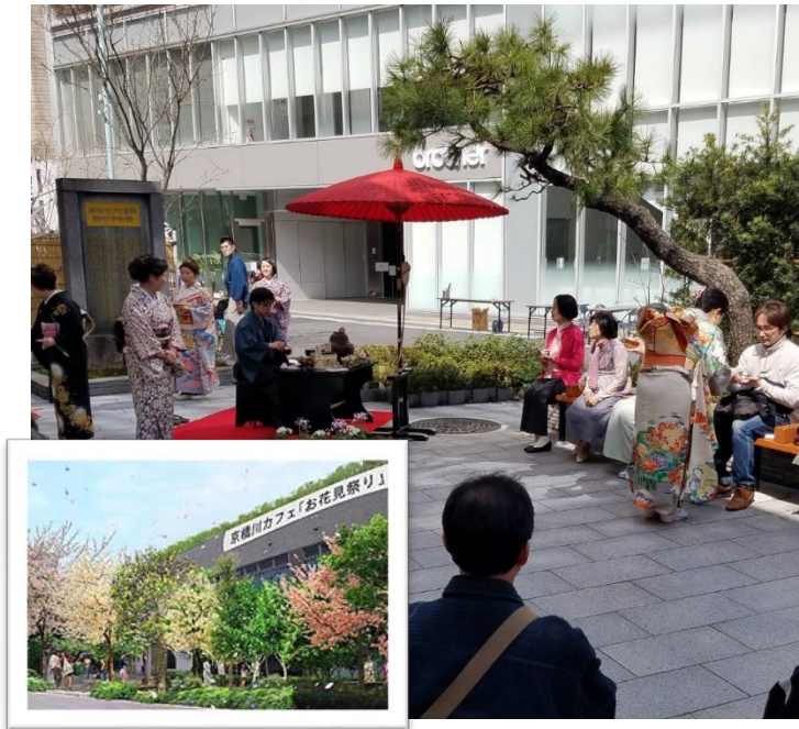
■ 公益財団法人東京都公園協会 「日比谷公園おもてなしのバラ園」