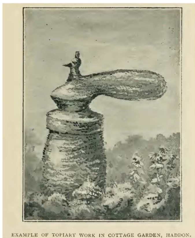
[ 図 6-5 ] コテージガーデンのトピアリーの例 Haddon.

ロッキンガム Rockingham にある美しく丸く刈り込まれた生垣、Erbistock の生垣や木はこの時期の剪定されたイチイの 2 つの代表例である。 しかし、この時代の本を見ると、イチイとは違った別の低木 shrubs のことがより好ましいものとして語られている。 ということは、 イチイは成長が遅く、たくましい木で、常緑樹であったために、他の低木に比べイチイの方がたくさん生き残ったということのようだ。 パーキンソンは「イチイを使うこと」について「果樹園のコーナーと建物の窓に面して、この両方で植えられるのは、この木が常緑であるため、日陰と飾りの両方に役立つから」と言っている。一方、セイヨウイボタについては「この植物がここまで多く、ここまで頻繁にこの国全体を通じて使われるのは、庭園その他における生垣やあずまやを作るだけの目的であるにもかかわらず、ほかの植物ではできない、どんな形にでも刈り込んだり、方向づけたり、形づくるのがしやすいからで、動物であろうと鳥であろうと武具を着けた男であろうと何でも好きな形にできた：それは生垣の茂みであっただけなのに、私はそれを忘れることはできない」と書いている。「あなたの庭師は」とローソンが 1618 年に書いたところによると「あなたの小さな森を、戦場において今にも戦いに臨もうとしている武具をつけた男の姿に形づくることができる：または足の速いグレーハウンドが鹿を追いかけたり、野ウサギを捕まえる形にできる。このような狩りなら食料、ましてやお金を無駄にはしないであろう」。