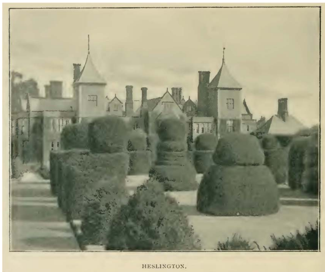
[ 図 6-5 ] Heslington

剪定された木は普通はイチイの木、という観念は大変広く広まっており、古い庭園に今も残っている昔のトピアリーはこの印象が正しいことを示している。ヨーク近くの Heslington の庭園にある剪定された木すべてがイチイである。 この庭園は、館が建てられた直後、1560 年頃、設計されたものである。