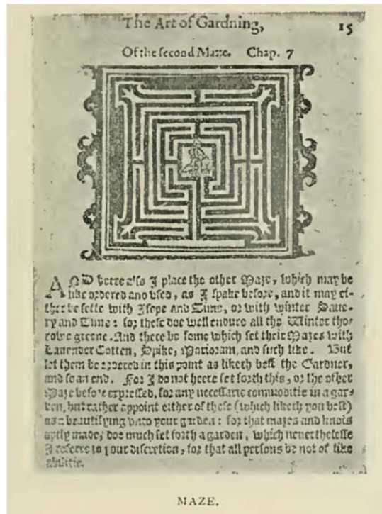
[ 図 6-4 ] 迷路

迷路 maze は、今や多くの庭園で見られるようになったもう一つの特徴であった。 「ラベンダー、cotton spike、マジョラムなどで作られた迷路、あるいはヒソップとタイム、サンザシの生垣 quickset、セイヨウイボタ、枝を組み合わせた果樹で作られた ( † Thomas Hill. )。ローソンは迷路を作る際の説明をしており、「迷路が人間の背の高さまで作られた場合、あなたのお友達はベリーを摘みながら歩き回り最後はあなたの助けなしには迷って出ることにはできない」と言っている。トーマス・ヒルは迷路について 2 つのデザインを提案しているが、これは「庭園になくてはならないもの」というのでなく、「むしろ」・・・「自分の庭園にそのような余地があって希望するなら迷路の一つでも設けて・・・その空いている場所に・・・時々はその中で遊ぶことを唯一の目的とするために取っておくのが一番よいであろう」と述べている。