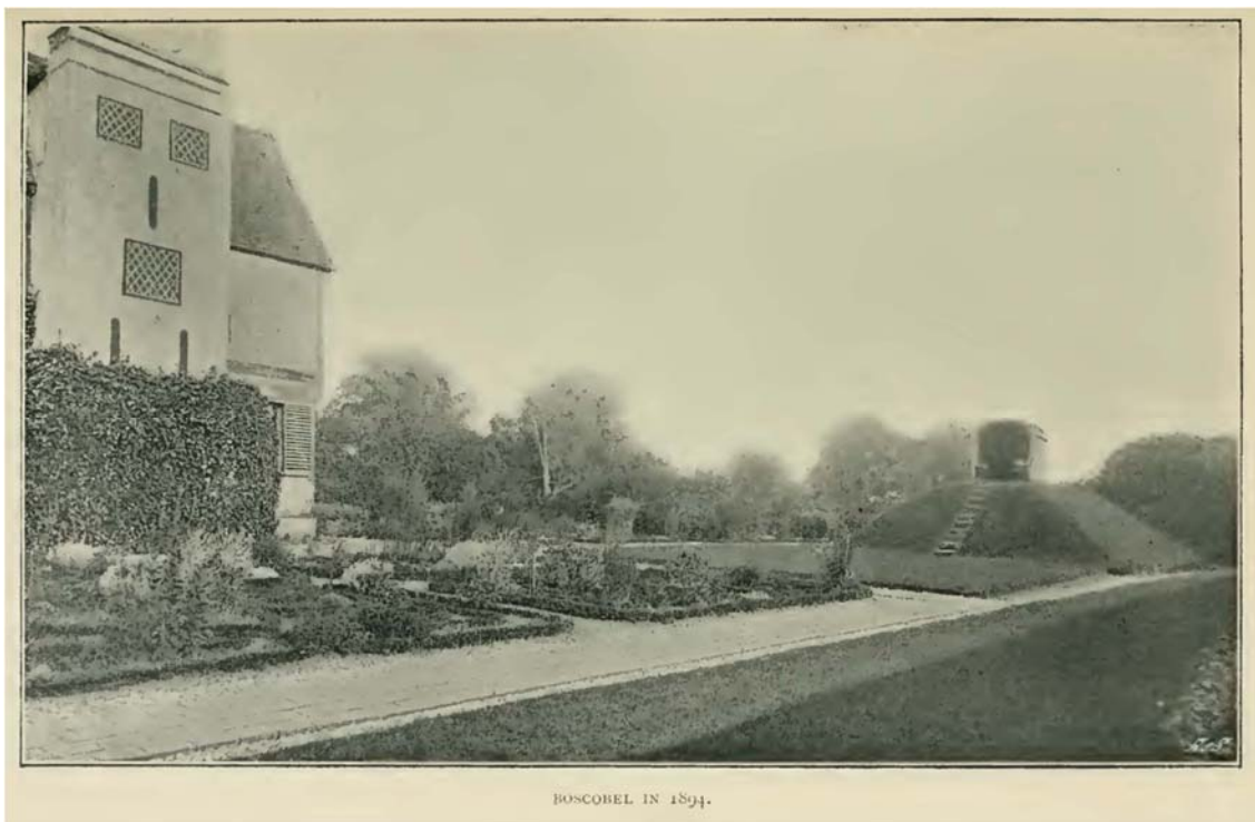
[ 図 6-2 ] Boscobel 1894 年

もちろん、そのような宴の館は国家的行事の時だけに建てられ、また裕福な人にしかできないことであった。 一般的な庭園の高台では極めて質素な姿のあずまやが乗っているくらいだった。 そのような高台というのは眺めの良さを確保できるポイントとして大変便利であったであろう。特に、テラスをかさ上げできるほどには庭園がそれほど立派ではなかったり大きくない場合にはそう言えよう；しかし、このような比較的控え目な庭園では、花の咲く植物やつる植物が植えられていない限り、高台は美的な対象とはなりえなかったであろう。 そのような高台は Boscobel に今も見ることができる。 これ以上質素なものを見つけることはおおよそできないであろう；そしてこれは私が今話している高台の多分良い実例の一つになると思われる。もっともこれはエリザベス朝時代ほど初期のものではありえないが。この高台は建物が建てられた 1620 年頃、時を同じくして作られた可能性が高く、チャールズ 2 世 [在位 1660~85 年] がすぐそばのオークの木の中に隠れた時、その高台は今ある姿と同じ形になっていた。