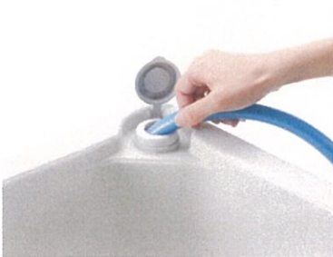
立ったままで楽々給水