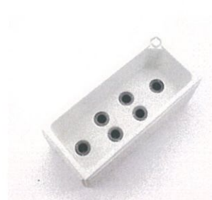
6 個の灌水脚で雨水と肥料を再吸収して利用