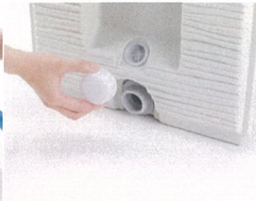
排水による冬季の凍結防止